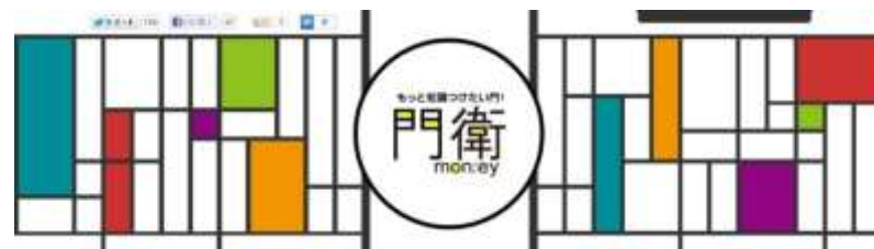
ここでしか読めない専門家の記事が、あなたの役に立ちますように。

大切なお金のこと、つきたい知識をつきたい時に。 お金「money」と購買の間に立つ「門番」となれますように。 そんな思いで運営していくユーザーの知識向上支援サイトです。